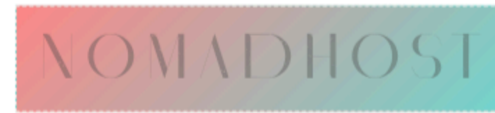
No sobre fondos complejos