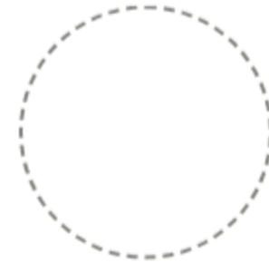
ACCENT Via submarca

La marca madre es estructural: dark + white + neutros. Cada submarca aporta su paleta de destino. El sistema escala sin conflicto cromático.