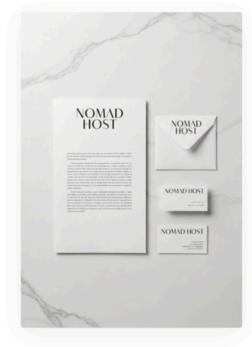
Membrete, sobre y tarjetas. Logo Black Gold centrado en zona superior. Marcellus para datos.