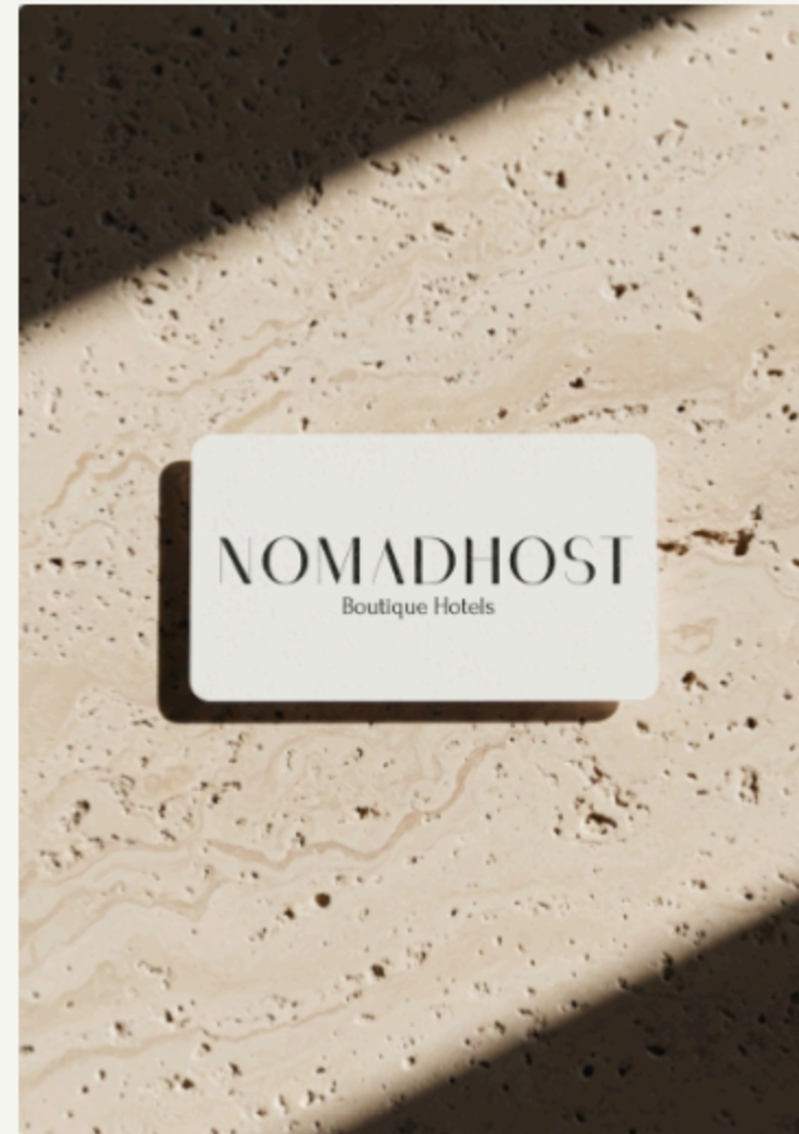
Cartulina off-white. Logo Black Gold VP Display Rough + "Boutique Hotels" en Marcellus.